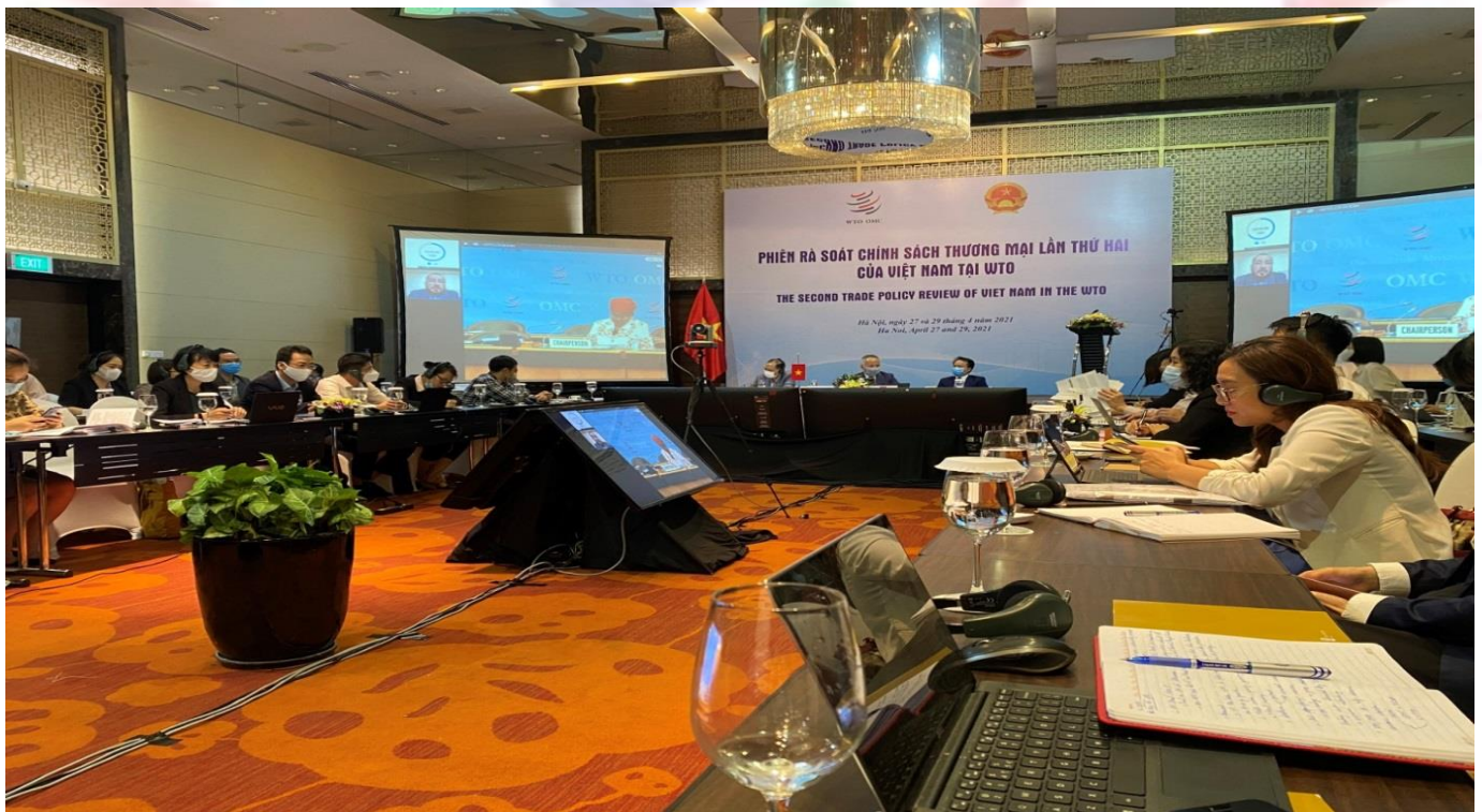
Phiên rà soát chính sách thương mại lần thứ 2

Liên quan tới cam kết với Hiệp định TBT của WTO, trong báo cáo Quốc gia cũng như góp ý Báo cáo của Ban thư ký WTO về rà soát chính sách thương mại lần thứ 2 của Việt Nam, các thông tin liên quan tới chính sách xây dựng, ban hành và áp dụng tiêu chuẩn, quy chuẩn kỹ thuật và thủ tục đánh giá sự phù hợp đã được cung cấp đầy đủ. Việt Nam cũng đã trả lời hơn 30 câu hỏi của các nước thành viên WTO liên quan tới hài hòa tiêu chuẩn quốc gia của Việt Nam với tiêu chuẩn quốc tế, chính sách liên quan tới ghi nhãn sản phẩm hàng hóa, thủ tục đánh giá sự phù hợp với sản phẩm, hàng hóa, xây dựng và ban hành quy chuẩn kỹ thuật cũng như thực hiện nghĩa vụ minh bạch hóa.